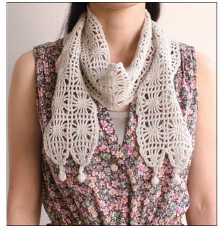
デザイン/前芽 由美子 「麻とコットンでやさしく編めるニット」 (ブティック社刊)